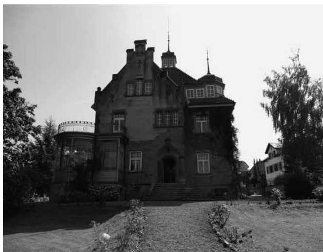
Villa Roseck, Rosenbergstrasse 5, Kirchberg; Innenrenovation.

Seit dem Jahr 2017 ist dieses Gebäude als Kulturobjekt von kantonaler Bedeutung ausgeschieden. Die Gesamtkosten belaufen sich auf Fr. 374'148.–. Darin sind denkmalpflegebedingt anrechenbare Aufwendungen von Fr. 128'514.– enthalten. Bei