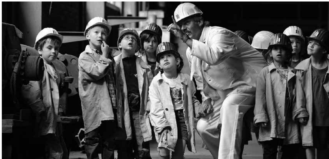
Bei einer Betriebsführung erklärt und vermittelt ein Fachmann den Kindern Hintergründe, Voraussetzungen und konkrete Ideen.

Der Verein rechnet für die Initialisierungsphase des Projekts (2020–2022), das sich danach selbst tragen soll, mit Gesamtkosten in der Höhe von Fr. 265'000.–. Von Stiftungen und privaten Geldgeberinnen und Geldgebern werden rund 95'000 Franken erwartet, die Projektierungskosten von rund 25'000 Franken werden über Eigenleistungen erbracht. Der Kanton St.Gallen, angefragt für einen Beitrag von Fr. 85'000.–, begrüsst das Engagement von «Helvetia spricht» zur Sensibilisierung für die Gleichstellung und unterstützt das Projekt Referentinnen-Pool mit Fr. 30'000.–.