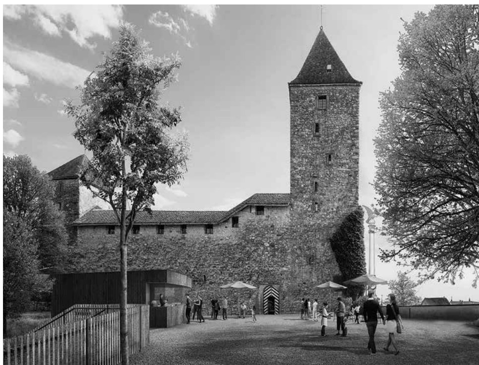
Hauptschlossansicht mit neuem Pavillon.