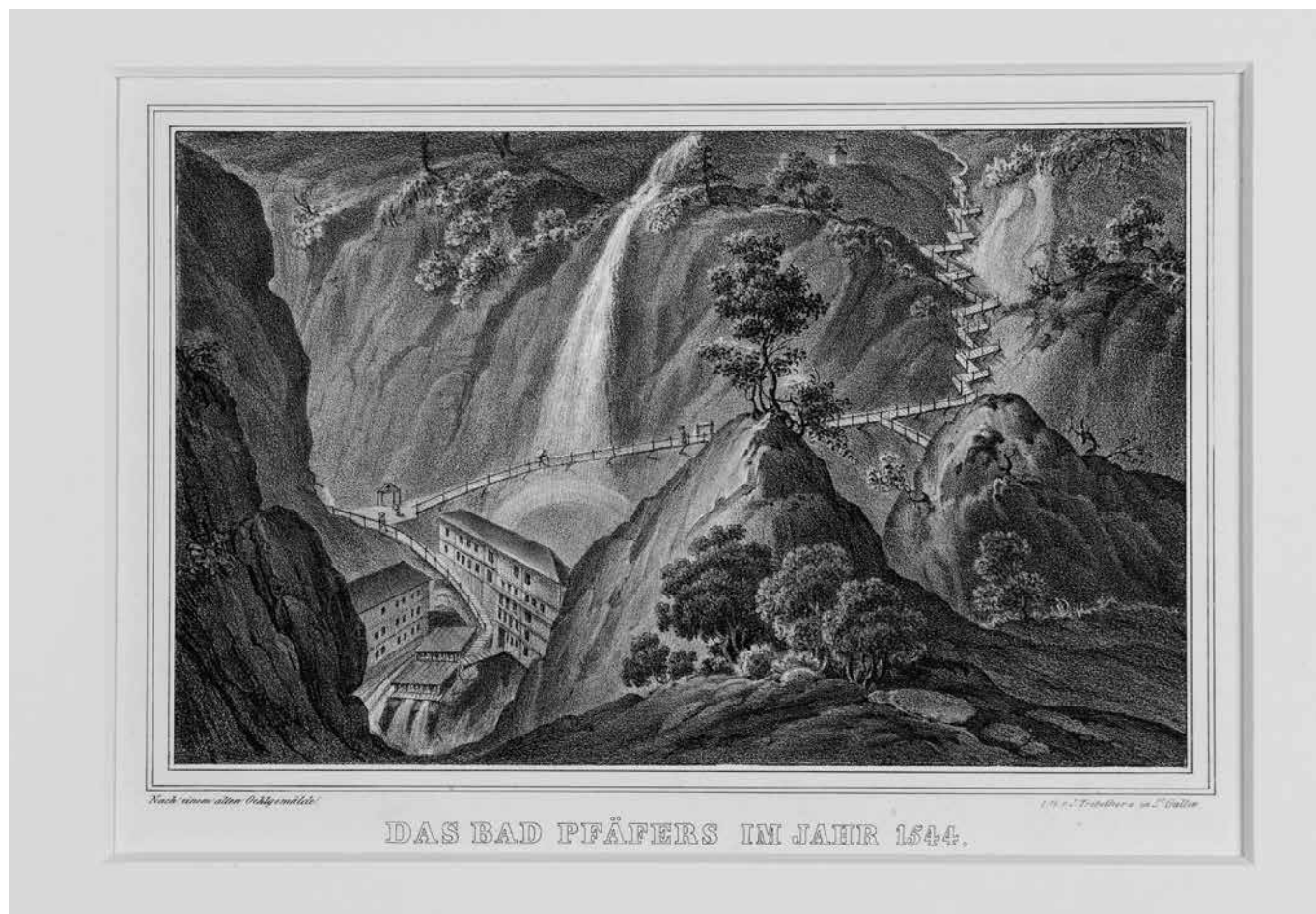
Die Sammlung von Otto und Margrit Schneider umfasst auch zahlreiche Ansichten des Alten Bad Pfäfers, wie diese aus dem Jahr 1544.