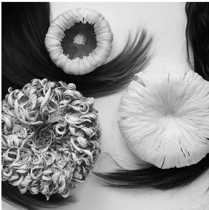
Céline Arnould arbeitet für ihre aktuellen Arbeiten vorwiegend mit Haaren und benutzt sie als Form für Schmuck- und Erinnerungsgegenstände aus Porzellan. 2020 hat sie für ihre Arbeit «Liasion» einen Werkbeitrag erhalten. (Bild: zVg Céline Arnould)

hart getroffenen Kulturschaffenden wird für 2021 eine Erhöhung der Werkbeiträge beantragt. Dadurch sollen mehr Kulturschaffende durch dieses ausserordentliche Förderinstrument unterstützt werden. Denn anders als Kulturunternehmen haben Künstlerinnen und Künstler 2021 keine Möglichkeit mehr, beim Kanton für Covid-bedingte Ausfälle eine Entschädigung zu beantragen.