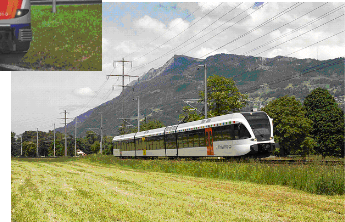
Thurbo: GTW 2/8