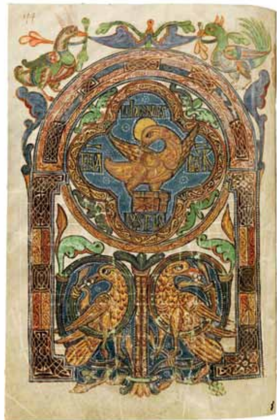
Darstellung des Symbols des Evangelisten Johannes im «Liber viventium» der Abtei Pfäfers.

Die Ausstellung «Bücher des Lebens» richtet sich sowohl an Fachleute als auch an eine breite, kulturhistorisch interessierte Öffentlichkeit. Sie wird von Mitte September bis Anfang November 2010 im Kulturraum