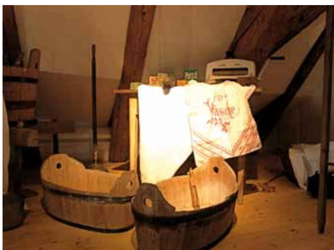
Typische Themen von Orts- und Regionalmuseen:

Der Zeitplan sieht vor, dass im ersten Quartal 2010 die Vorbereitungsarbeiten laufen, im zweiten Quartal die Projekte ausgeschrieben werden können und