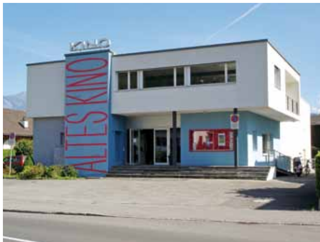
Der Kulturbetrieb im Alten Kino Mels soll zum 25. Geburtstag auf eine sichere Basis gestellt werden.

Das Alte Kino Mels ist durch die bestehenden Hypothekar- und Darlehensschuldzinsen und die laufenden Unterhaltskosten jedoch stark belastet. Die Kulturstiftung muss der Kulturvereinigung deshalb seit jeher ei-