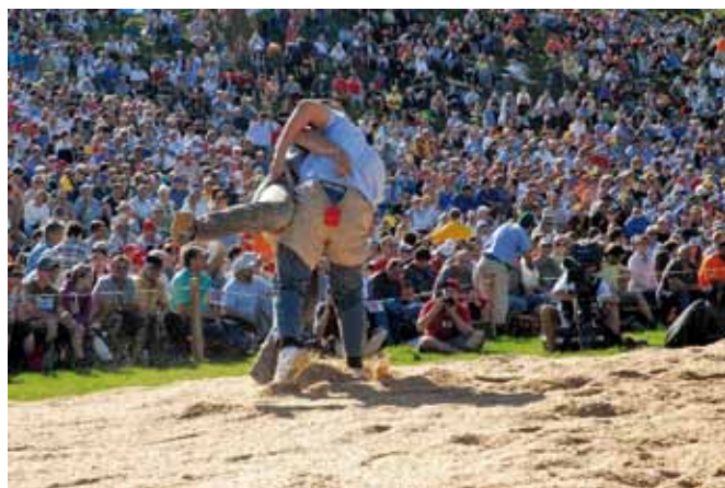
Jährlich faszinieren die starken Ostschweizer Schwinger, wie hier am Schwägälpschwinget 2009, tausende Anhänger des Schweizer Nationalsports.