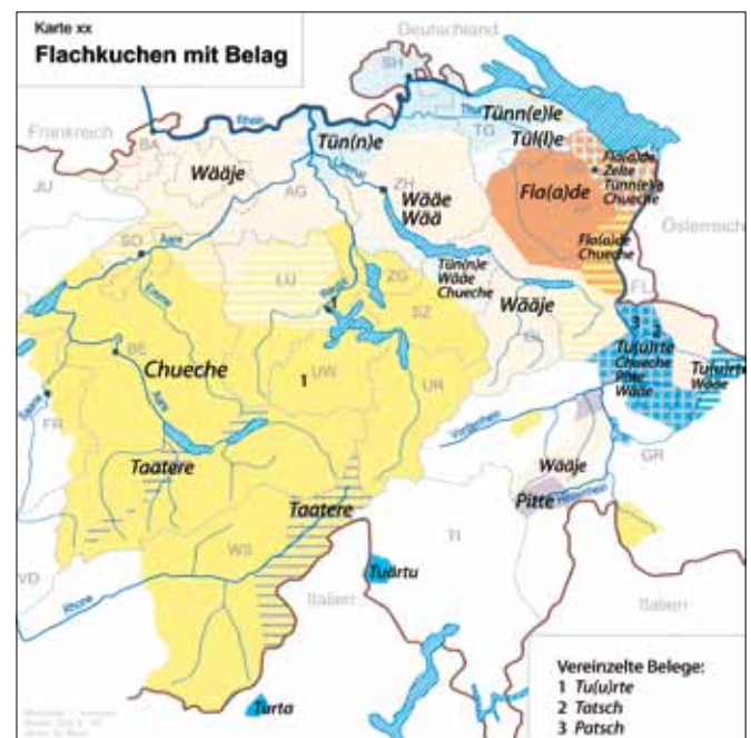
Der Kleine Sprachatlas stellt die Dialekte der deutschsprachigen Schweiz auf rund 150 Sprachkarten in ihrer Vielfalt dar.

Für das sprachwissenschaftliche Projekt sind insgesamt Fr. 323'200.– budgetiert. Da der Kleine Sprachatlas zwar auf wissenschaftlicher Forschung beruht, aber eine Umsetzung und Aufarbeitung für die breite Öffentlichkeit vorsieht, kommt der Nationalfonds als Finanzierungsquelle nicht mehr in Frage. Die Universitä-