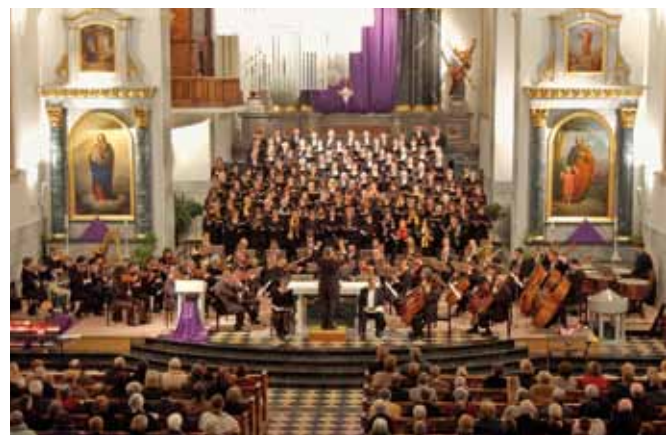
Der Fürstenlandchor bei der Aufführung von Johannes Brahms' «Ein deutsches Requiem» im Februar 2004 in der Andreaskirche Gossau.

Kaum eine der «sangesfreudigen Töchter», die sich 1885 zu einem Chor zusammaten, dachte wohl daran, dass sich aus ihrer Gruppe einmal ein stattlicher gemischter Chor entwickeln würde. Damals waren nur unverheiratete Frauen zugelassen. Heute sind rund sechzig Sängerinnen und Sänger von St.Gallen bis Wil Mitglied des Fürstenlandchors. Vereinzelt kommen von weit darüber hinaus zur Probe nach Gossau. Zum 125. Geburtstag erarbeitet der Chor nun das Werk «Lobgesang» von Felix Mendelsohn und schliesst sich dafür mit dem befreundeten Kammerchor Schaffhausen und mit der Süddeutschen Philharmonie Konstanz zusammen. Aufführungen sind im Frühling 2010 in Gossau, Niederuzwil und Schaffhausen geplant. Insgesamt werden knapp 200 professionelle Musikerinnen und Musiker sowie musikbegeisterte Laien am Grossprojekt beteiligt sein. Federführend ist wiederum der erfahrene