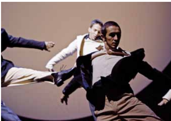
Szene aus dem Stück «Contre Dance» der Tanzkompanie St.Gallen 2008.

Es wird mit einem Produktionsbudget von rund 80'000 Franken und für die drei Aufführungen in St.Gallen mit Aufführungskosten von Fr. 20'000.– gerechnet. Der Finanzierungsplan sieht neben nichtbudgetierten ehrenamtlichen Leistungen in der Administration Eigenleistungen von Fr. 18'000.–, Fr. 15'000.– von Privaten und Stiftungen, Fr. 5'000.– vom Kanton Zürich, Fr. 8'000.– von der Stadt St.Gallen vor. Die Stadt Zürich hat bereits Fr. 25'000.– zugesichert. Aufgrund des Bezugs zum Kanton und des innovativen Vorhabens wird ein Beitrag von ebenfalls Fr. 25'000.– ausgerichtet.