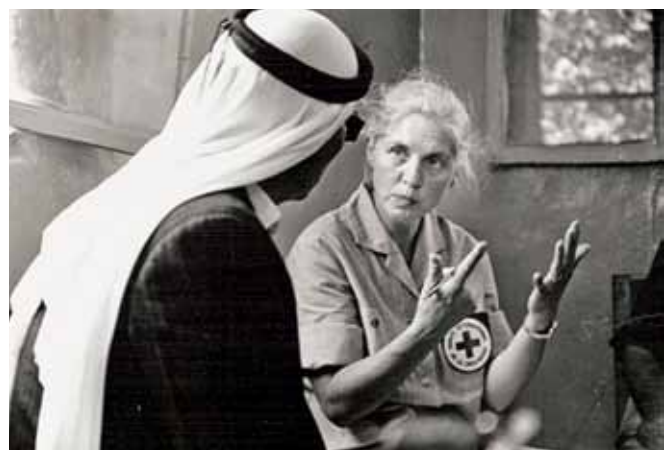
Tausende von Schweizerinnen und Schweizern haben einen wichtigen Teil ihres Lebens der humanitären Hilfe gewidmet. Hier in der Nähe von Ramallah, Westjordanland, 1967.

Am Gesamtaufwand des humem-Projekts von rund 2 Mio. Franken beteiligen sich bisher die Loterie Romande mit einem Beitrag von Fr. 100'000.–, die Direktion für Entwicklung und Zusammenarbeit DEZA mit einem Beitrag von Fr. 200'000.– sowie diverse Stiftungen und humanitäre Organisationen. Die Arbeiten am Inhalt des humem-Projekts ist damit finanziert; zurzeit werden Interviews mit Zeiteuginnen und Zeiteugen geführt. Für die Realisierung der Ausstellung rechnen die Verantwortlichen mit Lotteriefondsgeldern der Kantone, in denen die Ausstellung gezeigt wird. Der Kanton St.Gallen unterstützt das vielversprechende neue Oral-History-Projekt der erfahrenen Ausstellungsmacher mit einem Beitrag von Fr. 80'000.–, sofern sich wenigstens drei weitere Deutschschweizer Kantone beteiligen.