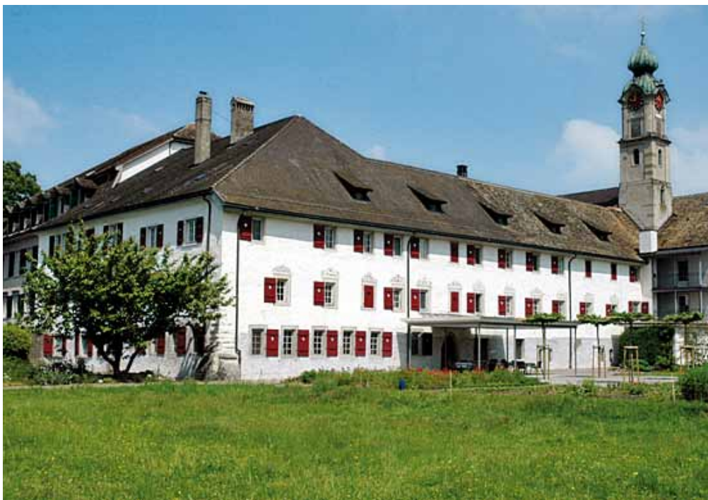
Kloster Wurmsbach Bollingen, Rapperswil-Jona

Das Kloster Wurmsbach feiert im November 2009 sein 750-jähriges Jubiläum. In den letzten Jahren wurden immer wieder Restaurierungsarbeiten vorgenommen, so diejenigen des Gästehauses und der Kirche im Jahre 2002/2003, der Pferdestallungen 2004 und des Gartenhauses 2008. Nun stehen umfangreiche Arbeiten am Konvent an, welche darauf hinzielen, das Gebäude etwas zeitgemässer einzurichten, die Haustechnik zu modernisieren und die Räumlichkeiten zurückhaltend, und dennoch besser auf die Bedürfnisse der alternden Schwestern abzustimmen. Gleichzeitig sind die schon sehr lange anstehenden Probleme mit dem Grundwasser zu lösen, welche sowohl dem Refektorium und auch dem ebenfalls sehr wertvollen Kapitelsaal erhebliche Schäden zugefügt haben. Als vorgängige Arbeiten wur-