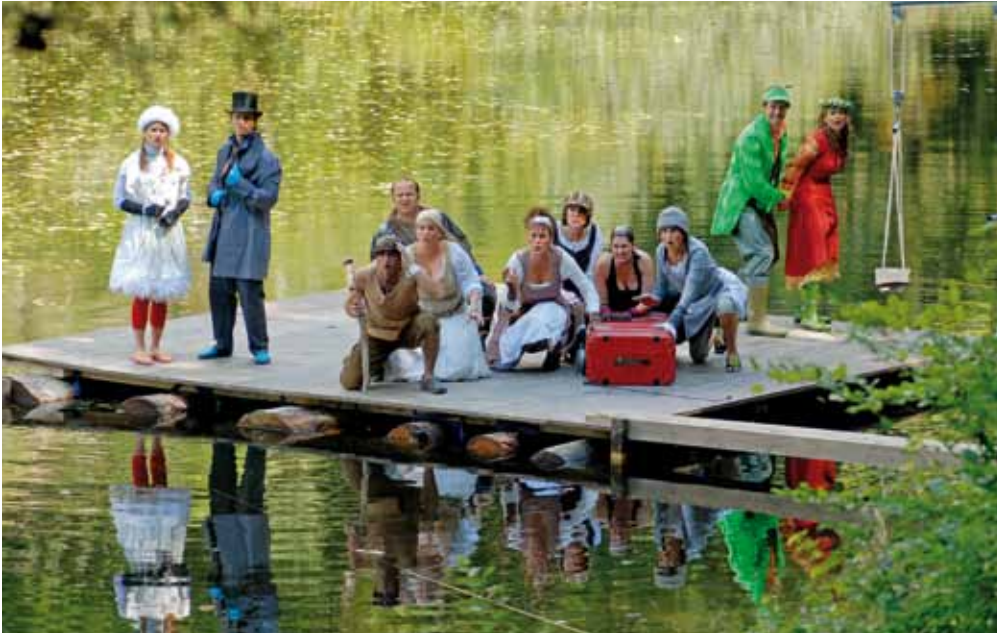
Erstes Freilichttheatertreffen 2007: Der Uznacher Theaterverein Commedia Adebar am Theaterspaziergang im Freilichtmuseum Ballenberg mit seinem preisgekrönten Stück «Der Linthwurm».

berg zur Aufführung. Die Beteiligung der Theaterschaffenden (Laien und Profis) war gross und namhafte Grossproduktionen wie kleine, feine Inszenierungen kamen zur Aufführung. Die Produktionen vermittelten Einblicke in die vielfältigen Ansätze des schweizerischen Theaterschaffens und ermöglichten einen Austausch und die längst fällige Vernetzung unter den verschiedenen Akteuren des sich zusehends professionalisierenden Theaterbereichs.