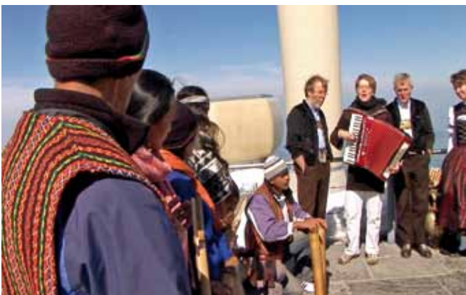
Die Philippinischen Kalingas treffen auf dem Sântis auf Toggenburger Naturjodel.

beitrag sowie Fr. 10'000.– vom Kanton Appenzell Ausserrhoden finanziert. Der Finanzierungsplan der Postproduktion (rund 90'000 Franken) sieht Beiträge von Stiftungen und der öffentlichen Hand vor. Der Kanton beteiligt sich am professionellen Projekt mit Fr. 20'000.– aufgrund des Bezugs und des Kulturaustauschs, insbesondere aber der grossen Parallelen zur Tradition und Identität durch Naturklang im Toggenburg.