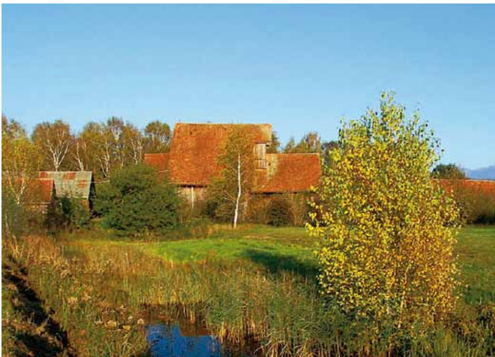
Das Areal der Schollenmühle im Naturschutzgebiet Bannriet. Bald wird hier ausserschulische Umweltbildung angeboten.

In den Kerngebäuden der Schollenmühle soll ein Ort entstehen, an dem die wichtigsten Informationen zu Themen rund um Lebensräume, Tiere und Pflanzen des Riets anschaulich dargestellt werden. Für die Umweltbildung sind fünf Hauptthemen geplant: 1. Entstehung und Entwicklung des St.Galler Rheintals, 2. Torfabbau: Handtorfstich, 3. Torfabbau: industrieller Abbau, 4. Das