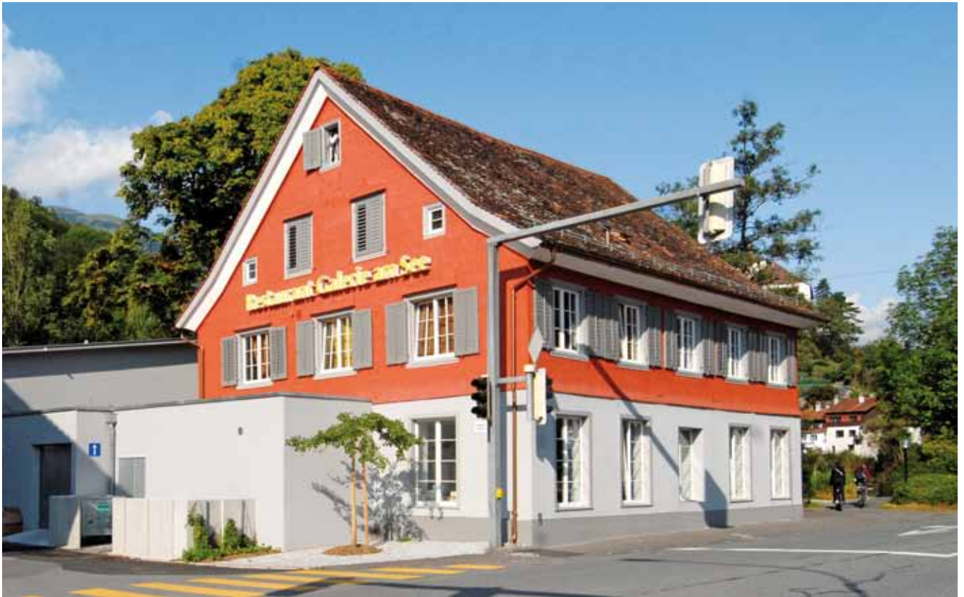
Restaurant Schlossgarten Buchs