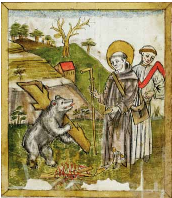
«Gallus und der holztragende Bär», um 1455

Gallusjubiläum 2012 – Gallus gemeinsam Fr. 1'250'000.–