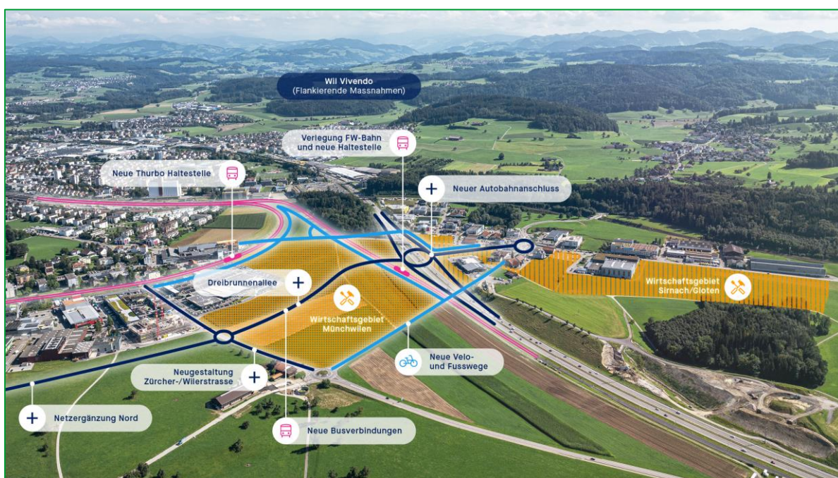
Abbildung 1: Elemente des Gesamtvorhabens WILWEST.

Das Gesamtvorhaben umfasst zahlreiche raumplanerische, verkehrliche und infrastrukturelle Massnahmen. Die einzelnen Massnahmen entfalten nur in ihrem Zusammenspiel die volle Wirkung. Sie bedingen sich weitgehend gegenseitig und werden unter dem Dach einer koordinierenden Projektorganisation von unterschiedlichen Projektträgern in unterschiedlichen Verfahren realisiert.