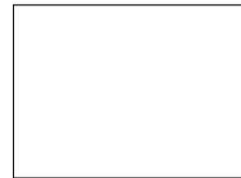
Bild: Die Bereitstellung bedürfnisgerechter Kinderbetreuungsangebote fördert die Vereinbarkeit von Familie und Beruf.

Der Kanton St.Gallen setzt sich aktiv für die Erreichung der Chancengerechtigkeit für sämtliche Bevölkerungsgruppen ein. Er stellt zielgruppenspezifische Förder- und Integrationsangebote bereit und trägt der Vielfalt der Lebensformen angemessen Rechnung.