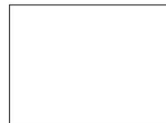
Bild: Die IT-Bildungsoffensive macht Gesellschaft und Wirtschaft bereit für die Herausforderungen der Digitalisierung.

Der Kanton St.Gallen nutzt die Möglichkeiten von neuen Technologien und Methoden für die digitale Transformation und gestaltet den digitalen Wandel schweizweit prägend mit. Er schafft so einen Mehrwert für Bevölkerung und Wirtschaft und gewährleistet die Sicherheit im digitalen Raum.