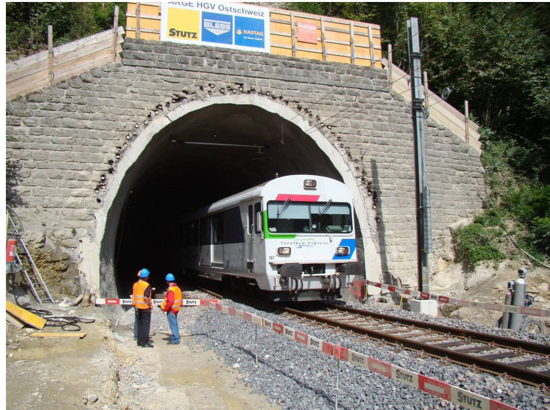
Bild: Südportal Bruggwaldtunnel, 7.9.09