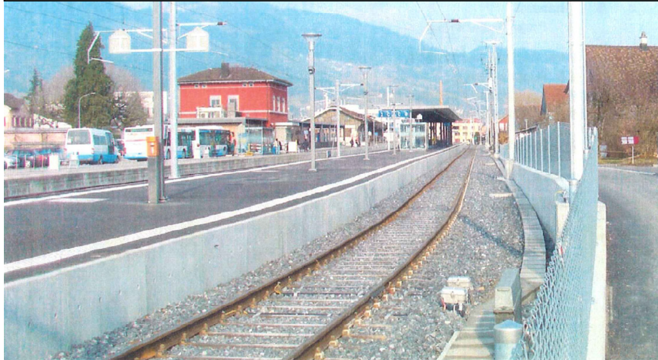
Bild: Bahnhof Altstätten, erstes abgeschlossenes Projekt HGV-A / LV

Bahnhof Altstätten seit 5.12.2008 in Betrieb