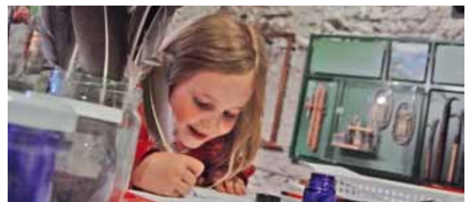
Am Internationalen Museumstag 2010 fand in allen vier beteiligten Museen die erfolgreiche Buchvernissage des «Südkultur»-Museumsführers «Ab ins Museum!» statt.

Die Kosten für die Lancierung des Kulturpasses und die Fortführung der «museumsgeschichte(n)» belaufen sich auf insgesamt rund 75'000 Franken. Sie setzen sich zusammen aus Ausgaben für den Personalaufwand für Organisation, Koordination und Durchführung der Kurse sowie Logistik-, Material-, Marketings- und Kommunikationskosten. Die Erträge aus den Kursgeldern sowie die Sponsoringbeiträge werden mit rund Fr. 15'000.– budgetiert. Südkultur leistet einen Beitrag von Fr. 30'000.–. Der Kanton beteiligt sich am regionalen Kulturvermittlungspilotprojekt mit einem Beitrag in derselben Höhe von Fr. 30'000.–.