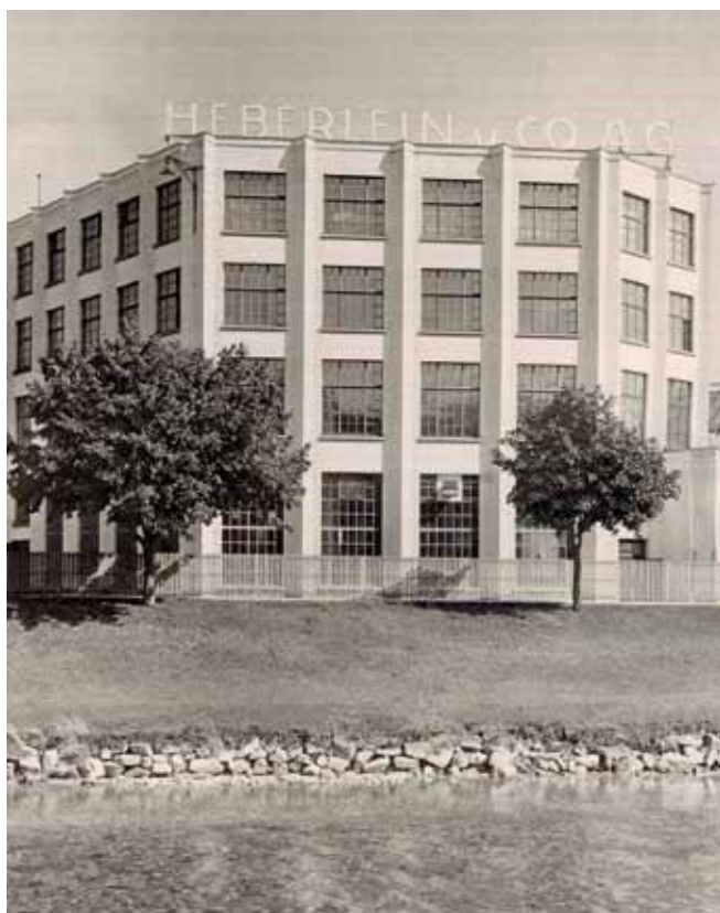
Haus Casablanca aus dem Jahr 1926, Westfassade, Wattwil

aus einer grossen Halle und einem 4 stöckigen Fabrikationsgebäude. Es wurde 1926 von den Architekten von Balmer und Ziegler erbaut und erhielt aufgrund seiner kompakten, modernen Erscheinung und dem weissen Anstrich schon bald den Übernahmen «Casablanca». Der Hochhausteil dieses in reiner Betonkonstruktion erstellten Gebäudes wird nun im Erdgeschoss einer gemischten Nutzung und in den darüber liegenden Etagen einer neuen Wohnnutzung zugeführt, wofür es umfassend renoviert, auf der Südseite mit Balkonen, auf dem Dach mit einer modernen Attika und innen mit einer neuen Erschliessung versehen wird. Das sorgfältig erarbeitete Projekt respektiert die statische Grundstruktur des Gebäudes und bewahrt seinen Charakter. Das Gebäudeäussere wird nach denkmalpflegerischen Gesichtspunkten restauriert, das Innere für die neue Nutzung vollständig erneuert. Der Denkmalpflegebeitrag ermöglicht einen Teil der erforderlichen Betonsanierungen, den Ersatz und die Gestaltung der für das Haus so typischen Fensterpartien sowie den Fassadenputz und die äusseren Malerarbeiten.